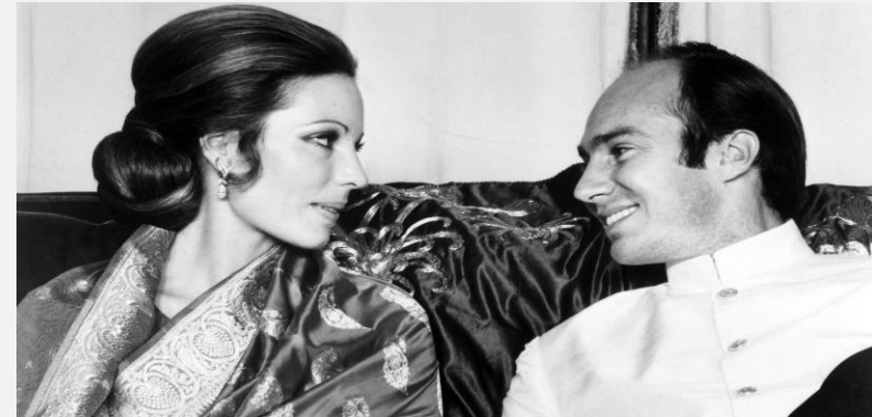
Karim Aga Khan y Begum Salimah en la víspera de su boda religiosa en París el 27 de octubre de 1969.